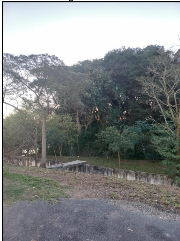
Fotografia do imóvel